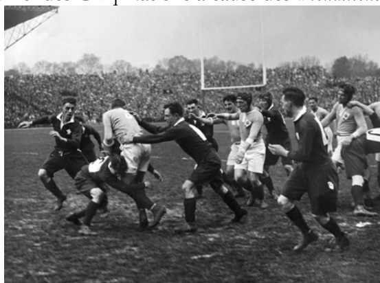
France – Galles 1930

Dans la foulée (1931), la France est exclue du Tournoi des Cinq Nations à cause des « conditions peu satisfaisantes dans lesquelles le rugby-football est dirigé et joué en France » : soupçons de professionnalisme et actes de brutalité gangrèment en effet le rugby français qui ne s'accorde plus aux valeurs des britanniques qui dirigent alors le rugby. La goutte d'eau qui fait déborder le vase tombe lors d'un très violent France-Galles 1930 qui s'achève par la demande plus que provocatrice du président de la Fédération française Octave Léry, lors du banquet d'après match, d'entrer dans l'International Board! C'en est trop pour les britanniques qui évincent la France du Tournoi.