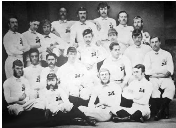
Équipe d'Angleterre (1871)

La première rencontre internationale eut lieu la même année. Elle opposa à Edimbourg les Écossais aux Anglais. Devant quatre mille personnes, les locaux l'emportèrent 4 à 1. L'Irlande débuta sur la scène internationale face à l'Angleterre en 1875, suivie par le Pays de Galle en 1881. En 1884, ces quatre nations se rencontrèrent pour la première fois, ce qui marqua la naissance du futur Tournoi des 6 nations.