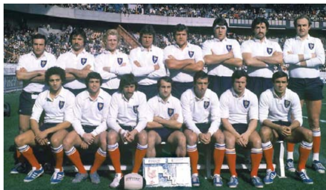
Les 15 joueurs du Grand Chelem 1977

Pendant ce temps, Béziers écrase le rugby français des années 1970 (dix titres de champion entre 1971 et 1984), suivi dans les années 1980-90 par Toulouse (neuf titres glanés entre 1985 et 2001).