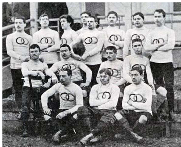
Sélection USFSA (1893)

Les English Tailors, négociants en tissus anglais, créent en 1877 le premier club de rugby-football parisien. Le rugby se développe alors surtout dans les écoles et universités parisiennes. En 1892, la première finale de l'histoire du rugby français est arbitrée par le Baron de Coubertin. Le Racing Club de France l'emporte sur le Stade Français 4-3. L'année suivante (1893), la première tournée de joueurs français en Angleterre est organisée par l'Union des Sociétés Françaises des Sports Athlétiques (USFSA).