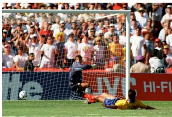
Le csc d'Escobar

sélectionneur Francisco Pacho Maturana a dû toutefois se priver des services de Gabriel Gomez, son milieu de terrain, qui a reçu des menaces de mort le matin même. L'homme ne jouera plus jamais sous le maillot colombien, persuadé que les menaces viennent de narcotrafiquants ayant des intérêts dans les paris sportifs. Sur le terrain, la Colombie perd 2-1 avec un but contre son camp (csc) du malheureux Andrés Escobar. Elle est éliminée. Quelques jours plus tard, Escobar surnommé « el Caballero de la cancha » (le gentleman du terrain) est à Medellin, sa ville de naissance, où il porte les couleurs de l'Atletico Nacional depuis 1985. Mais le 2 juillet, après une altercation il est abattu de six balles sur un parking. À chaque coup de feu, l'agresseur crie « gol ». Il sera condamné à 43 ans de prison, mais libéré en 2005 pour bonne conduite.