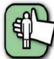
Protection du personnel

https://blog.univ-reunion.fr/detroi/vie-du-laboratoire/accueil-des-stagiaires-et-nouveaux-entrants/