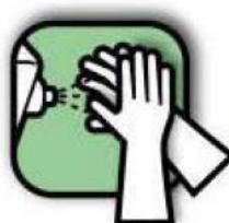
Hygiène des mains

Les précautions standards et les règles générales de bonne pratique de laboratoire sont regroupées dans le Guide des Bonnes Pratiques de Laboratoire et Règles d'Hygiène et de Sécurité .