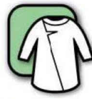
Protection tenue de travail