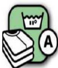
Traitement du linge