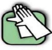
Port de gants