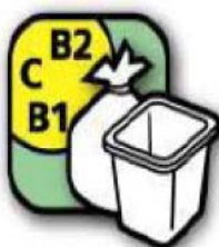
Gestion des déchets