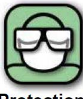
Protection respiratoire et oculaire