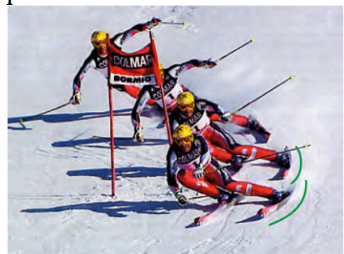
Rayon théorique 27m - taille 191cm

Jusqu'à la fin des années 1990, les compétiteurs utilisaient des skis assez longs, plutôt étroits et avec une ligne de côte peu marquée. Puis, sous l'influence du snowboard, les fabricants ont produit des skis plus large aux extrémités et plus resserrés au centre (en « taille de guêpe »). Cette forme incurvée associée à un ski plus court (de 10 à 20 cm de moins que la taille du skieur) permet une meilleure accroche sur la neige. De plus, le rayon de courbure est plus petit et l'amorce du virage plus aisée. C'est ainsi qu'un ski de slalom spécial possède un rayon de 11 m, alors qu'un ski de géant a 27 m de rayon, celui de super G 40 m et que le ski de descente est à 50 m.