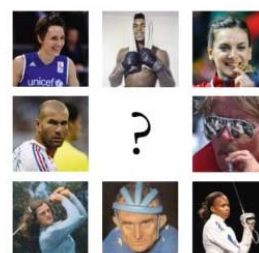
Carnet de visites sportives Tome 1 : des athlètes aux golfeurs