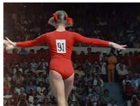
Le duel Roumanie - Russie. Gymnastique artistique féminine. JO 1980

En 1976 et 1980, la présence de la Roumaine Comăneci renforce encore un peu plus l'incertitude du résultat. Et si à Montréal, les Soviétiques ont gagné le titre, celui-ci s'annonce compliqué pour les Jeux 1980 qui ont lieu à chez eux, à Moscou. La lutte entre la Roumanie de Bela Karoly et l'URSS d'Alexandre Arkeiev s'annonce en effet plus qu'indécise. Malheureusement pour la Roumanie, Nadia chute aux barres asymétriques, enterrant du même coup les espoirs de victoire de son pays.