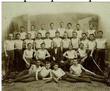
Unité Sokol de Prague, 1899

Jusque dans les années 1920, les gymnastes évoluaient avec un pantalon en coton s'arrêtant en dessous du genou.